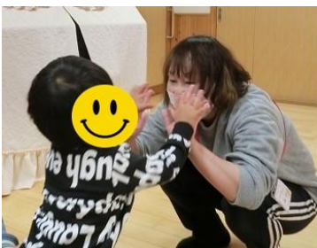
☆手のひらでタッチ