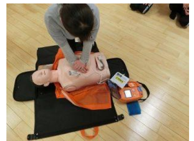
胸骨圧迫(心臓マッサージ)