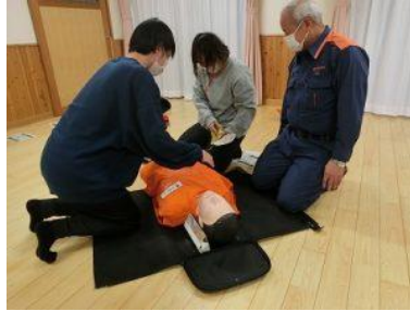
AED が到着したら装着