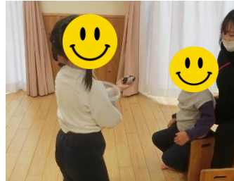
お手玉を配るお手伝いができました。そして、みんなでお手玉で遊びました。