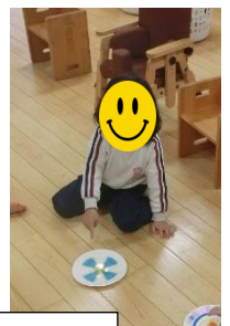
牛乳パック、ペットボトルのキャップ、ボタンで作った紙皿のこまをみんなで回して遊びました。