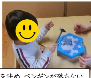
指導員とじゃんけんをして順番を決め、ペンギンが落ちないように氷を崩すゲームをしました。